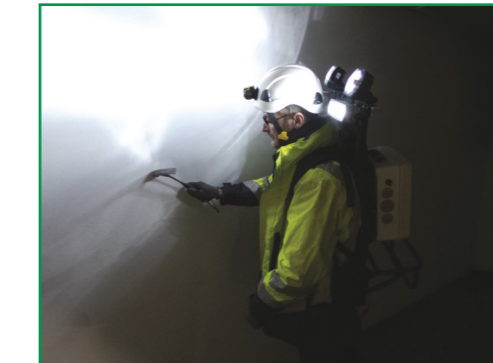
Matériel d'investigations spécifiques en tunnel

Nous avons développé depuis plusieurs années des techniques, équipements et logiciels spécifiques à nos missions. Plusieurs de nos logiciels sont déposés à l'INPI.